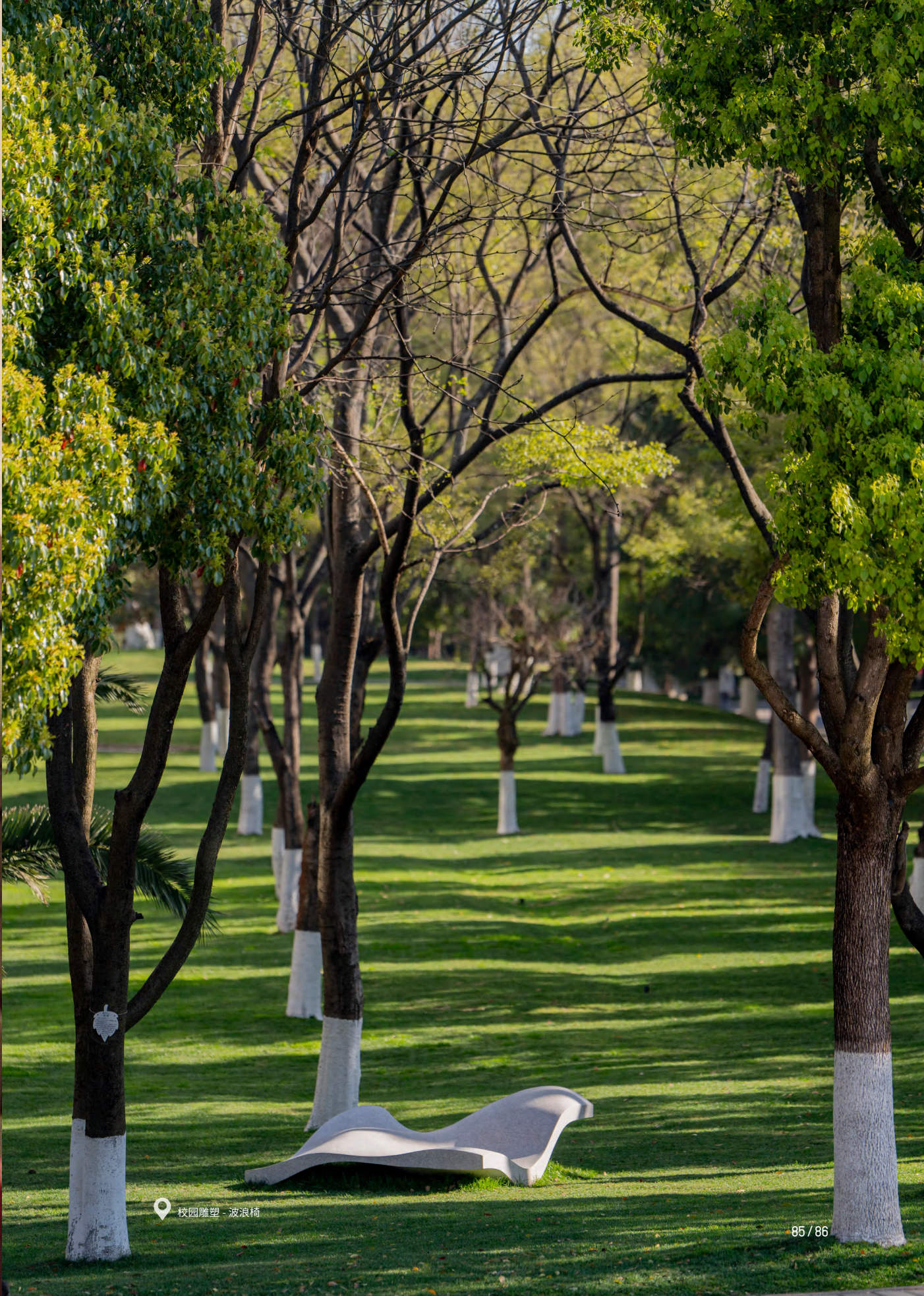
校园雕塑 - 波浪椅