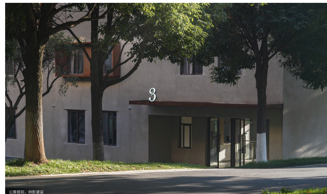
公寓楼前，树影婆娑