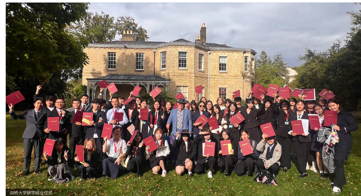
剑桥大学研学结业仪式