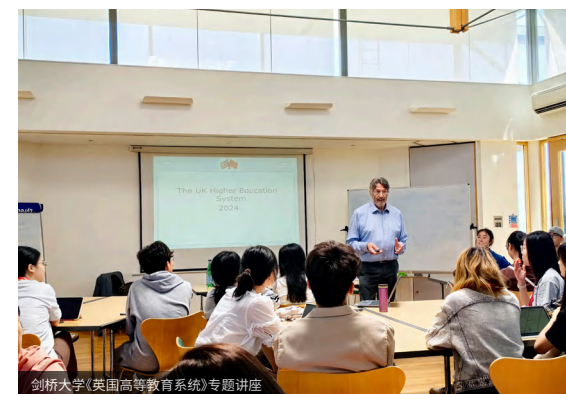
剑桥大学《英国高等教育系统》专题讲座

近三年, 学校出国留学学生达到200余人, 先后派出近1000名同学前往美国、英国、荷兰、韩国、泰国等国家和地区开展交换、游学、带薪实习等项目, 收获英国剑桥大学、香港大学、东京大学等世界名校推荐信; 更有多名学子被英国贝尔法斯特女王大学、英国约克大学、利物浦大学等名校录取。