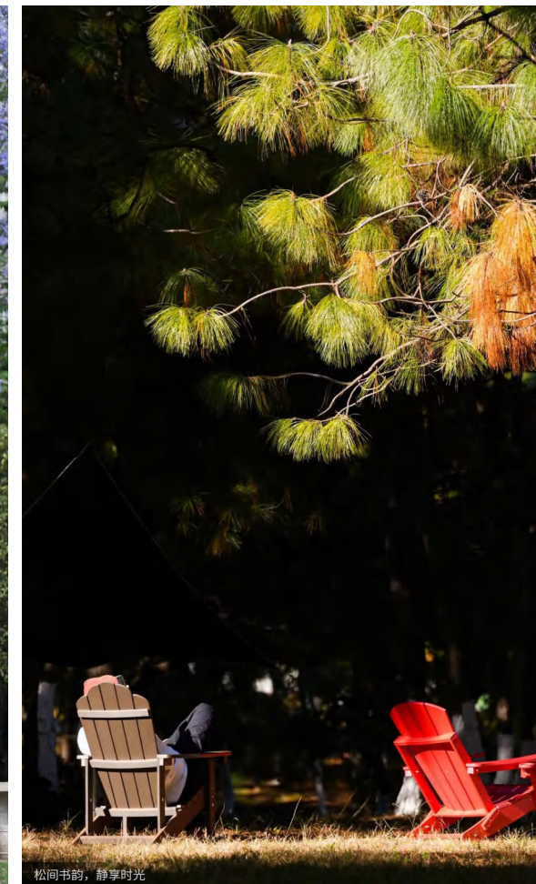
松间书韵，静享时光