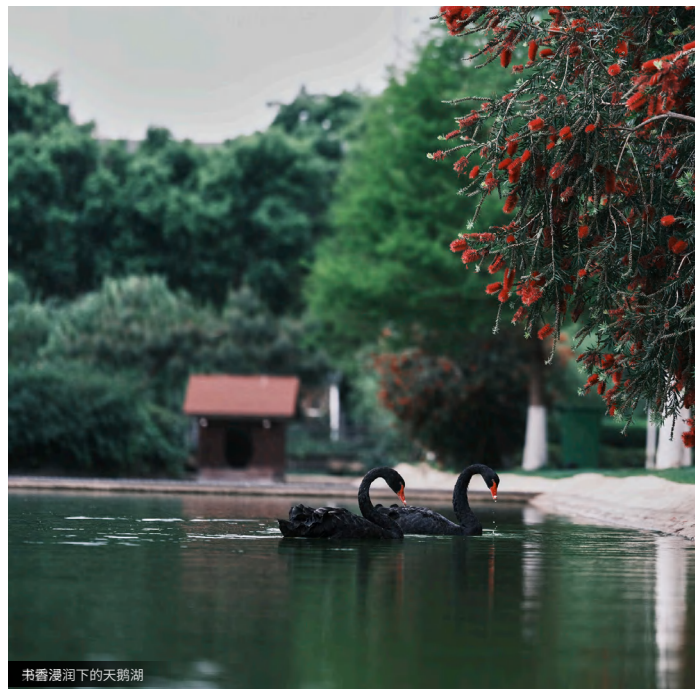
书香漫润下的天鹅湖