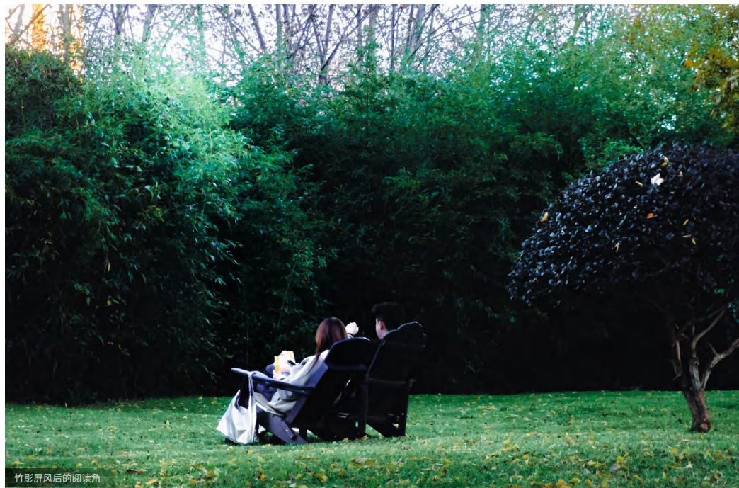
竹影屏风后的阅读角