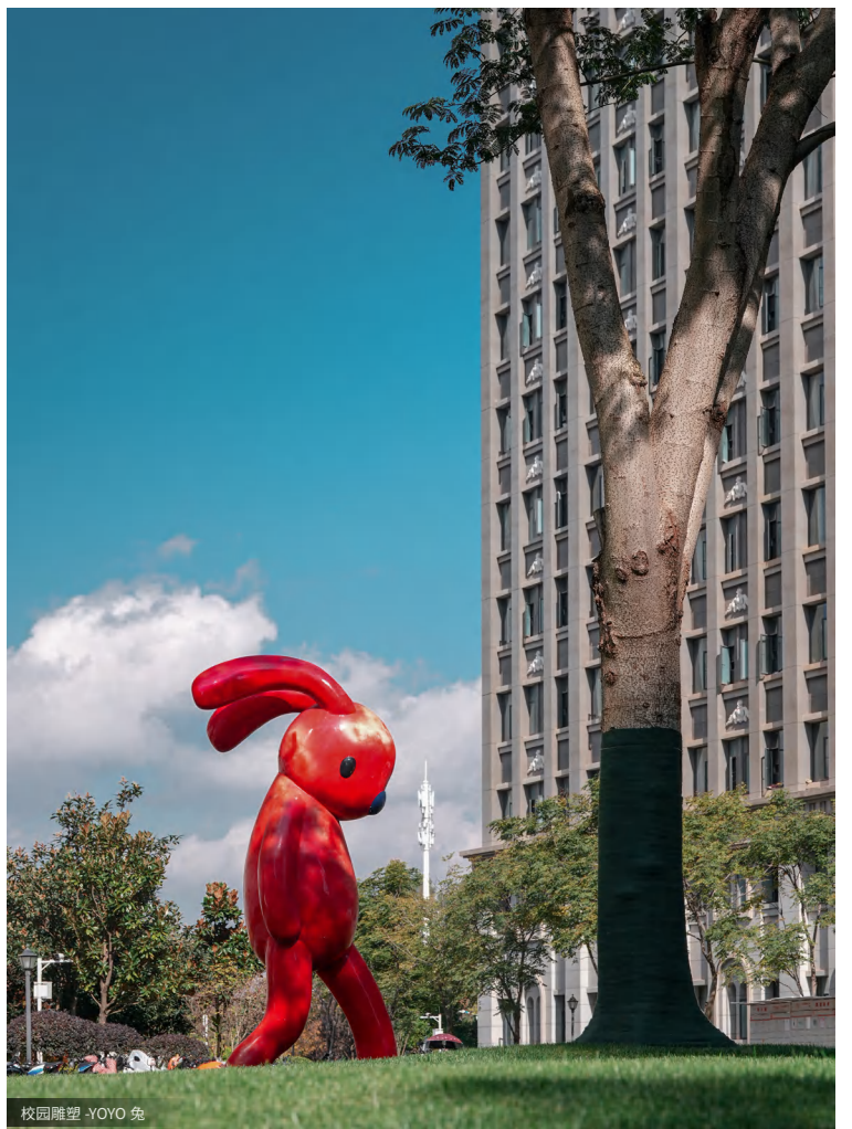
校园雕塑 -YOYO 兔