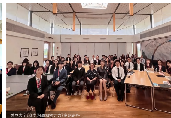
悉尼大学《商务沟通和领导力》专题讲座