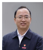
蒋永文 教授 云南工商学院校长 云南师范大学原校长、党委书记 HEADMASTER'S MESSAGE

学校在校生人数26000余人，开设专业涵盖工学、管理学、经济学、医学、教育学、艺术学、文学等7个学科门类。在云南省高校本科专业综合评价中，2024年学校25个专业获评优质专业，居全省同类院校第一。连续十余年毕业生去向落实率持续保持在97%以上，被评为“全国高校就业50强”。