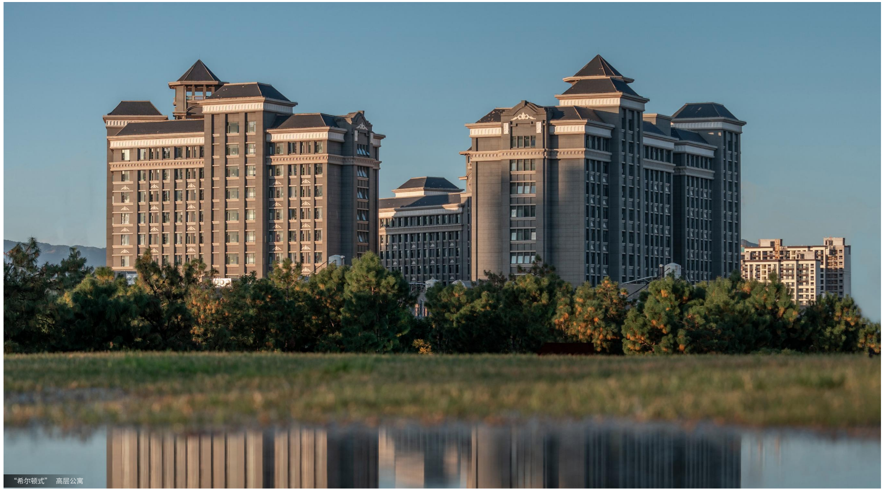
“希尔顿式” 高层公寓